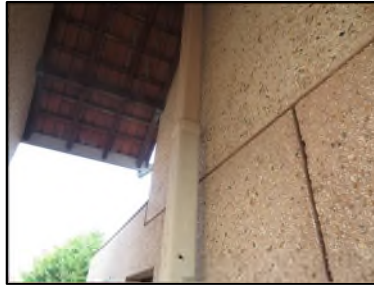
Photo N° 588 AMIANTE CIMENT -- PALIER VOLEE ESCALIER +3 Gaines & coffres verticaux Ventilation haute (Fibres-ciment)